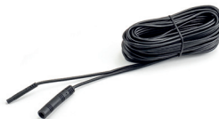
extension cable (AK1020)