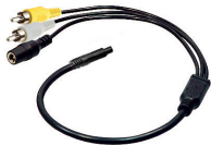
adapter cable (AK1011)