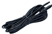
extension cable (AK1013)