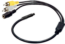
adapter cable (AK1014)