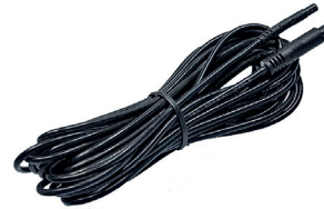
extension cable (AK1020)