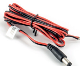
power cable (AK1001)